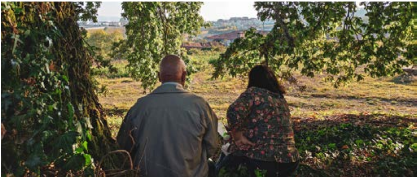
Περιβαλλοντική εκπαιδευτική δραστηριότητα σχετικά με τα γιγάντια αυτοφυή δέντρα στη Λουσάδα της Πορτογαλίας

08. Προώθηση γεφυρών μεταξύ των οργανώσεων που συνδέονται με τη διατήρηση της φύσης και των ενώσεων που υποστηρίζονται από την κοινότητα των ηλικιωμένων. Υπάρχουν πολυάριθμες ενώσεις ή μη τυπικές ομάδες ηλικιωμένων