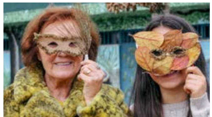
Διαγενακή δραστηριότητα για τη διατήρηση της φύσης μέσω της κοινωνικής προσέγγισης στη Λουσάδα της Πορτογαλίας