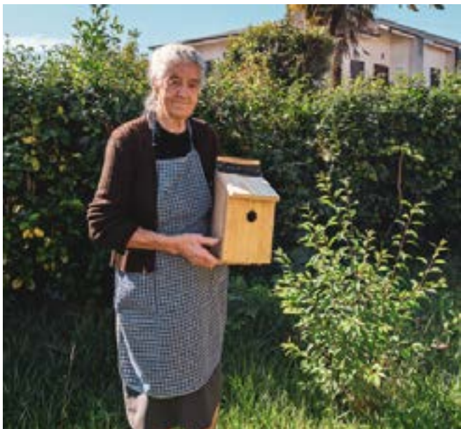
Τοποθέτηση μιας φωλιάς πουλιών στην αυλή ενός ηλικιωμένου στην Λουσάδα, Πορτογαλία