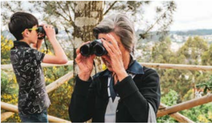
Διαγενεακή δραστηριότητα παρατήρησης πουλιών στη Λουσάδα, Πορτογαλία

και των άμεσα ωφελομένων. Ο φορέας υλοποίησης θα πρέπει να εντοπίσει επίσημες οργανώσεις ή/και ομάδες και να συναντήσει μεμονωμένα άτομα με τα οποία ενδιαφέρεται να συνεργαστεί, ανάλογα με το ποια ομάδα-στόχο θα στοχεύσει το πρόγραμμα (π.χ. ηλικιωμένοι που είναι ενταγμένοι σε ομάδες ή που διατρέχουν υψηλό κίνδυνο απομόνωσης, όπως αυτοί που ζουν μόνοι τους και ένα μέρος από πρωτοβουλίες που προωθούνται από το δήμο ή οργανώσεις). Με αυτόν τον τρόπο, αρχίζει η διαδικασία δημιουργίας των ομάδων παρέμβασης που θα κληθούν να συμμετάσχουν στο πρόγραμμα εθελοντισμού. Θα πρέπει να σημειωθεί