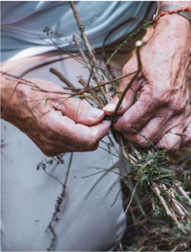
Εργαστήριο παραδοσιακών σκουπών από ντόπιους θάμνους (Λουσάδα, Πορτογαλία)

πρέπει να σκεφτόμαστε την προστασία ενός συστήματος που αποτελείται από ένα σύνολο στοιχείων, πόρων, οικοσυστημάτων και υπηρεσιών που είναι εγγενώς συνδεδεμένα και εξαρτώνται το ένα από το άλλο. Κάθε φυσικό οικοσύστημα λειτουργεί σε ισορροπία και αποτελείται από ένα πολύπλοκο δίκτυο όλων των ζωντανών και μη ζωντανών όντων που υπάρχουν σε μια δεδομένη περιοχή και επηρεάζουν τη συμπεριφορά και την επιβίωση άλλων όντων. Οι διαταραχές σε ένα οικοσύστημα σε ένα σημείο επηρεάζουν ολόκληρο το σύστημα, το οποίο είναι ταυτόχρονα ανθεκτικό και εύθραυστο. Η περίπτωση της καταστροφής των οικοτόπων που προκαλείται από την αποψίλωση των δασών είναι μια