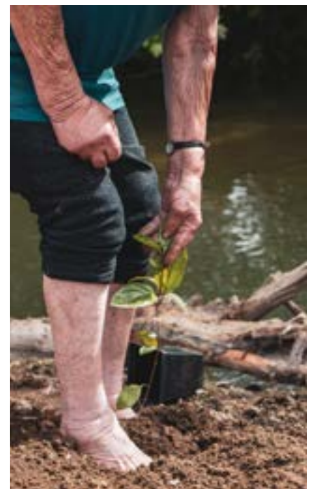
Διαγενεακή εθελοντική φύτευση γηγενών ειδών (Λουσάδα, Πορτογαλία)

Οι ανάγκες, τα εμπόδια, οι προκλήσεις και οι δυνατότητες του εθελοντισμού των ηλικιωμένων στον περιβαλλοντικό τομέα θα παρουσιαστούν λεπτομερώς στο παρόν εγχειρίδιο μέσα από την εμπειρία των εταίρων του Grey4Green, έτσι ώστε να μπορούν να ξεπεραστούν ευκολότερα από φορείς που ενδιαφέρονται να υλοποιήσουν παρόμοιες πρωτοβουλίες.