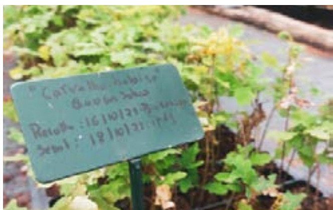
Φυτώριο δέντρων που κατασκευάστηκε από ηλικιωμένους στη Λουσάδα της Πορτογαλίας