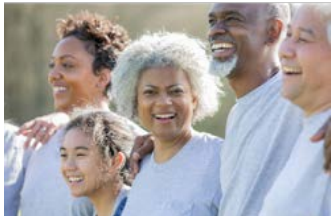
Διαγενεακή δραστηριότητα για τη φύση και τις τοπικές παραδόσεις στη Λουσάδα της Πορτογαλίας

Συνεπώς, είναι σαφές ότι ο επικεφαλής της ομάδας ή/και η ομάδα συντονισμού πρέπει να ενημερώνει λεπτομερώς τους εθελοντές για τους όρους που σχετίζονται με θέματα υγείας και ασφάλειας, λαμβάνοντας υπόψη τη χώρα στην οποία δραστηριοποιείται, καθώς και την πολιτική της ίδιας της οργάνωσης.