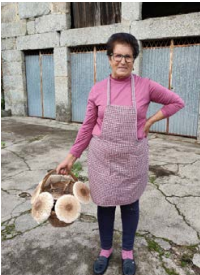
Συλλογή άγριων μανιταριών από ηλικιωμένη ειδικό στη Λουσάδα, Πορτογαλία

Είναι σημαντικό να σκεφτούμε το σύνθημα "Σκέψου παγκόσμια, δράσε τοπικά" που αυξάνει την ευαισθητοποίηση των πολιτών σχετικά με την υγεία του πλανήτη και των ανθρώπων και την ενεργό συμμετοχή των πολιτών στις κοινότητες και τις πόλεις τους. Πρέπει να γίνει πολλή δουλειά για τη διατήρηση της φύσης, δηλαδή να αυξηθούν τα σχέδια δράσης και η επιβολή της νομοθεσίας με στόχο να παραμείνουν ανέγγιχτα τα οικοσυστήματα, και να γίνει τεράστιο έργο διατήρησης. Η τελευταία έννοια προβλέπει τη διαφύλαξη των φυσικών αξιών μέσω δράσεων παρέμβασης, για παράδειγμα με την προώθηση διαδικασιών οικολογικής αποκατάστασης 'Η ανάκτησης 'Η με στόχο τη χρήση των πόρων με βιώσιμο τρόπο, μεταξύ άλλων δράσεων που στοχεύουν στην προστασία της φύσης.