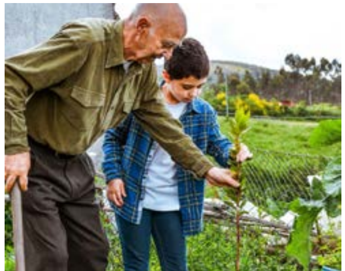
Διαγενεακή φύτευση μεταξύ παππού και εγγονού στη Λουσαδά της Πορτογαλίας