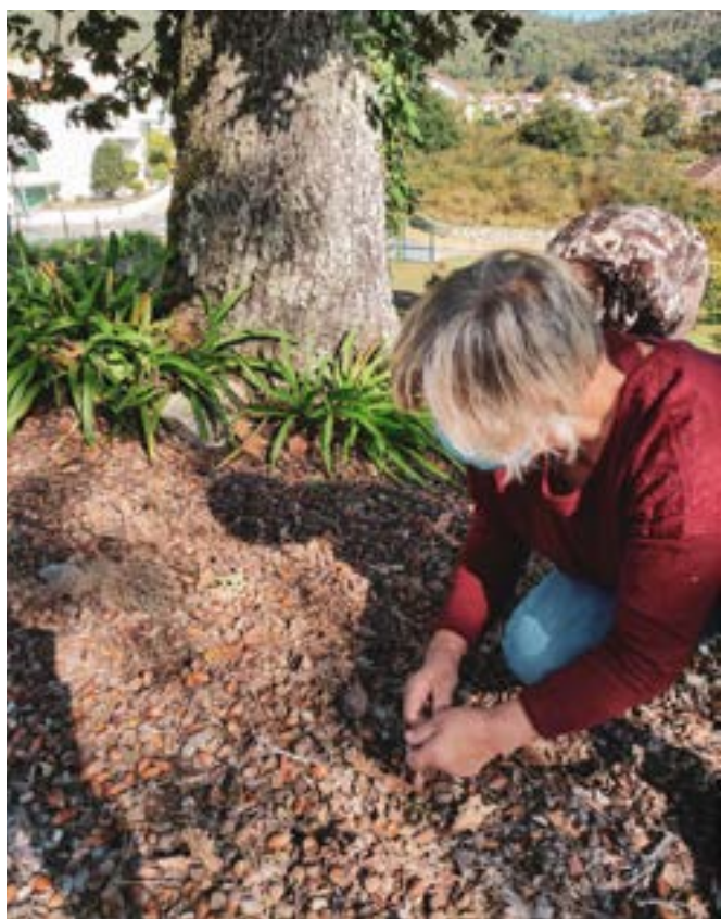
Συλλογή βελανιδιών από ηλικιωμένους για τη δημιουργία φυτωρίου δέντρων με ενδημικά είδη στη Λουσάδα της Πορτογαλίας