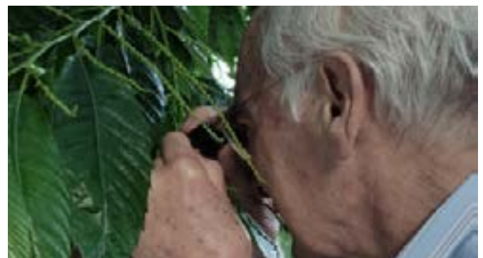
Παρατηρήσεις των δομών της χλωρίδας με μεγεθυντικό φακό σε προστατευόμενη περιοχή στην Πορτογαλία

Χώρες όπως η Δανία προσπάθησαν να αξιολογήσουν και να καθορίσουν περιβαλλοντικές προτεραιότητες και στόχους, (ιδίως στην περιοχή της Κεντρικής Δανίας). Γι' αυτό και το 2021 ανέπτυξε τη Στρατηγική Αειφορίας 2030 για την περιοχή της Κεντρικής Δανίας (Στρατηγική βιωσιμότητας 2030 για την περιοχή της Κεντρικής Δανίας). Ομοίως, η Ισλανδία έχει δημιουργήσει θεσμικές συνεργασίες μεταξύ της Υπηρεσίας Περιβάλλοντος της Ισλανδίας και άλλων φορέων, όπως τα Εθνικά Πάρκα, τα Κέντρα Έρευνας της Φύσης της Ισλανδίας, το Ισλανδικό Μουσείο Φυσικής Ιστορίας και άλλα, προκειμένου να αξιολογηθεί η κατάσταση των ισλανδικών προστατευόμενων περιοχών. Το 2021, η γαλλική κυβέρνηση δημοσίευσε τη Μέθοδο Περιβαλλοντικής Αξιολόγησης, προκειμένου να παράσχει ένα συνεκτικό και βιώσιμο σχέδιο, με στόχο την αξιοποίηση και την προστασία του περιβάλλοντος, τη δημιουργία αυστηρών κατευθυντήριων γραμμών για τις αρνητικές επιπτώσεις και την ενίσχυση των θετικών επιπτώσεων στο περιβάλλον, συμβιβάζοντας τα διάφορα εδαφικά ζητήματα μεταξύ του οικονομικού, του κοινωνικού και του περιβαλλοντικού τομέα.