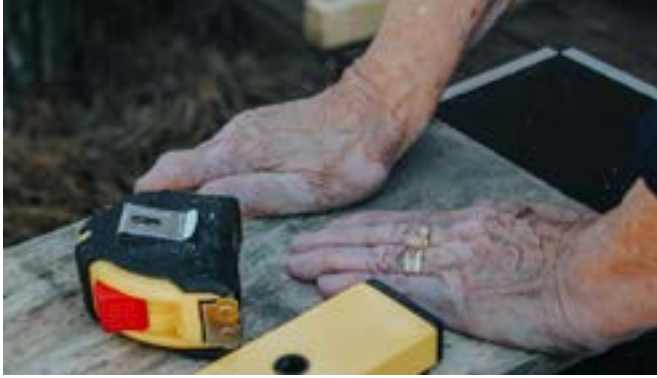
Κατασκευή ενός ξύλινου ξυλόφωνου σε μια περιβαλλοντική παιδαγωγική δραστηριότητα με ηλικιωμένους

έχει αντίκτυπο στον εθελοντή και διευκολύνει τον ενδοσκοπικό προβληματισμό. Από την άποψη των πνευματικών οφελών, υπάρχουν επιπτώσεις στο επίπεδο της προσωπικής ανάπτυξης και εξέλιξης, μέσω της αίσθησης της επίτευξης μπροστά στην πρόκληση που παρουσιάζεται. Ορισμένες εργασίες απαιτούν εξειδίκευση και συμβάλλουν σε νέες γνώσεις και στο αίσθημα ικανοποίησης για τη συνεισφορά στη διατήρηση της φύσης. Όσον αφορά το θέμα της ευεξίας, η ενεργός συμμετοχή σε εργασίες στη φύση ξυπνάει ένα αίσθημα ανθεκτικότητας και υπέρβασης, καθώς η εθελοντική περιβαλλοντική εργασία απαιτεί μερικές φορές σωματικές επιδόσεις. Οι ηλικιωμένοι έχουν σωματικές δυσκολίες και παρακινούνται να αναπτύξουν τη σωματική τους απόδοση, γεγονός που αποδεικνύεται παράγοντας σωματικής ικανοποίησης.