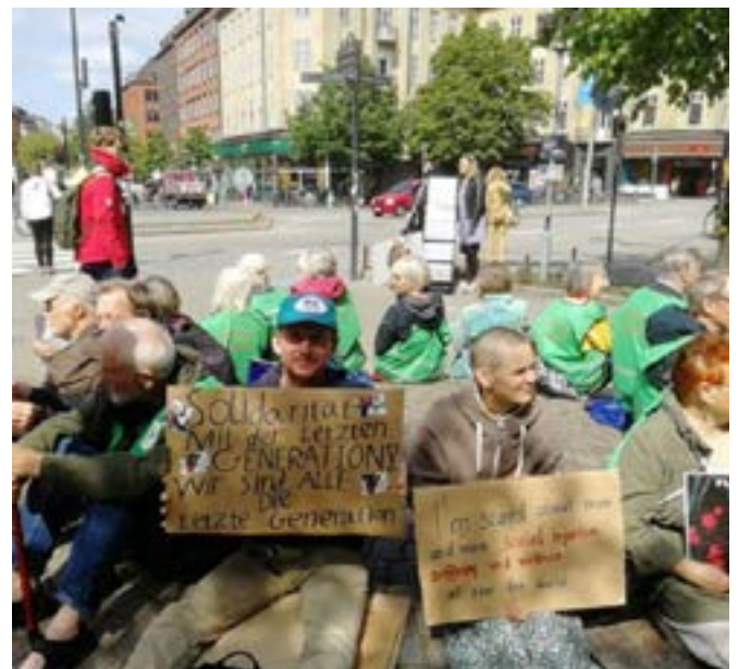
Παιπούδες και γιαγιάδες σε μια διαμαρτυρία για το κλίμα που πραγματοποιήθηκε στο Άαρχους της Δανίας

Άρθρο 45 Οι πάροχοι διασφαλίζουν ότι προστατεύεται το απόρρητο της προσωπικής και επαγγελματικής ζωής του εθελοντή, καθώς και τα προσωπικά του δεδομένα.