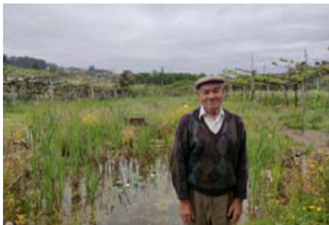
Artificial pond built by young volunteers in a senior's backyard in Lousada, Portugal