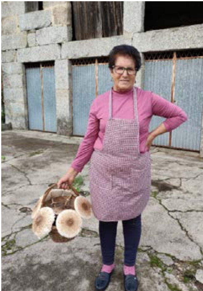
Indsamling af vilde svampe af en seniorspecialist i Lousada, Portugal

Det er vigtigt at understrege, at den ældre befolkning er i stand til at blive aktive agenter for at afbøde sådanne trusler, og de bør ikke betragtes som passive ofre, da dette er et overfladisk og begrænsende syn. Der er enighed om alliancen mellem politisk engagement og tværgående involvering af alle aktører i samfundet.