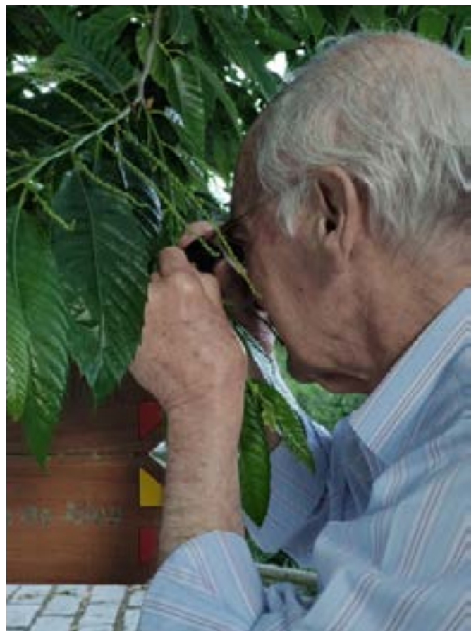
Observationer af florastrukturer med et forstørrelsesglas i et beskyttet område i Portugal

Den måde, risikovurdering og risikostyring udføres på, er uundgåeligt afhængig af graden af social og kulturel accept, politisk følsomhed og den økonomiske situation i de europæiske lande og i resten af verden. Den måde, risikovurdering og risikostyring udføres på, er uundgåeligt afhængig af graden af social og kulturel accept, politisk følsomhed og den økonomiske situation i de europæiske lande og i resten af verden. The state of the environmental and/or ecological quality of a region can be gauged by researching the region's own indicators, which are publicly