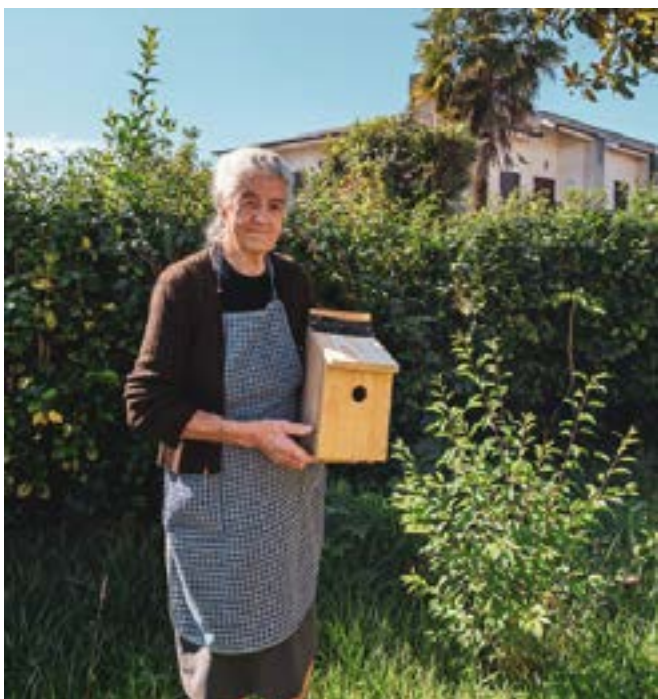
Placering af en fuglerede i en ældres baghave i Lousada, Portugal

Derfor har vi opstillet en række tiltag, der opfylder behovet for at bekæmpe sådanne globale udfordringer, men med lokal handling: