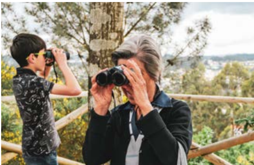
Fuglekiggeri på tværs af generationer i Lousada, Portugal

For at kunne skitsere et program for frivilligt arbejde med naturbeskyttelse er det først og fremmest vigtigt at foretage en undersøgelse af områdets bevaringsstatus og de miljømæssige/økologiske udfordringer, det står over for. Denne vurdering kan ske gennem et partnerskab eller samarbejde mellem initiativtagerorganisationen (NGO, daginstitution osv.) og f.eks. kommunen eller et universitet. Da frivilligt arbejde er baseret på socialt engagement i seniorsamfundet, vil det samtidig være relevant at vurdere de demografiske indikatorer i en given lokalitet eller geografisk region. En dybere viden om den miljømæssige og sociale kontekst (seniorprøve), der findes i området, vil således gøre det muligt at udforme en implementeringsstrategi, der er betydeligt mere tilpasset til konteksten;