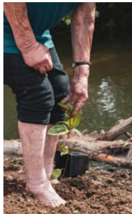
Frivillig plantning af indfødte arter (Lousada, Portugal)

Behovene, forhindringerne, udfordringerne og potentialet i frivilligt arbejde for seniorer på miljøområdet vil blive præsenteret i detaljer i denne håndbog gennem Grey4Green-partnernes erfaringer, så de lettere kan overvindes af enheder, der er interesserede i at gennemføre lignende initiativer.