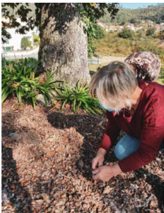
Indsamling af agern af ældre mennesker for at opbygge en planteskole med indfødte arter i Lousada, Portugal.