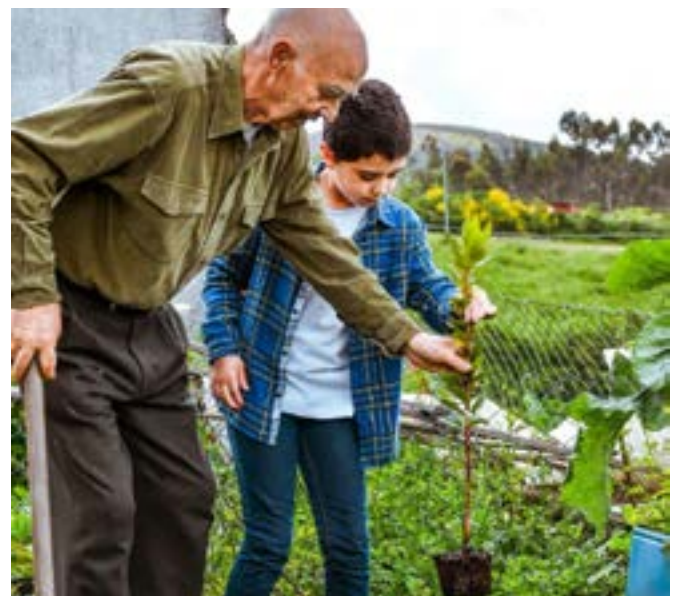
Generationsplantage mellem bedstefar og barnebarn i Lousada, Portugal