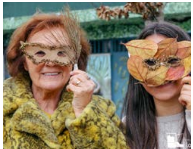
Aktiviteter på tværs af generationer om naturbeskyttelse gennem en social tilgang i Lousada, Portugal

De nævnte emner er blot nogle indikatorer, som organisationer kan anvende eller overveje for at give mere meningsfulde oplevelser med frivilligt arbejde, og som i det ideelle scenarie forårsager en form for forandring hos seniorer, dvs. tilføjer viden og læring, som ledsager dem i hverdagen.