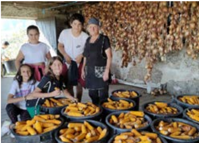
Afløb majs for at holde liv i den gamle landbrugstradition i en aktivitet på tværs af generationer i Lousada, Portugal

frivillige til deres land, og dermed være mere åbne over for et eventuelt samarbejde om miljøarbejde. Ud over tilfredsstillelsen ved at udføre frivilligt arbejde og dele erfaringer med ligesindede kan de frivilliges indbyrdes erfaringer også beriges ved at fremme mellemmenneskelige relationer, hvor der kan opbygges følelser af samarbejde, holdånd, forståelse, tolerance, ydmyghed, vilje til at lære af andre, tilpasningsevne og endda mulige venskabsbånd. En sådan kontakt mellem frivillige kan fremmes af organisationer, der fremmer frivilligt arbejde, og er en nøgelfaktor for, at de frivillige ser oplevelsen som en ægte personlig tilfredsstillelse. Organisationen kan på den anden side også opmuntre den frivillige til at tage initiativ til at forsøge at integrere sig selv som en del af regionens kulturelle og sociale liv ved at give den frivillige tips om steder og begivenheder inden for kultur, historie, fritid, sjov og natur (nationalparker, naturparker, byparker, beskyttede områder m.m.), som måske endda kan tjene som inspiration til det økologiske genopretningsarbejde, der udføres af ældre frivillige.