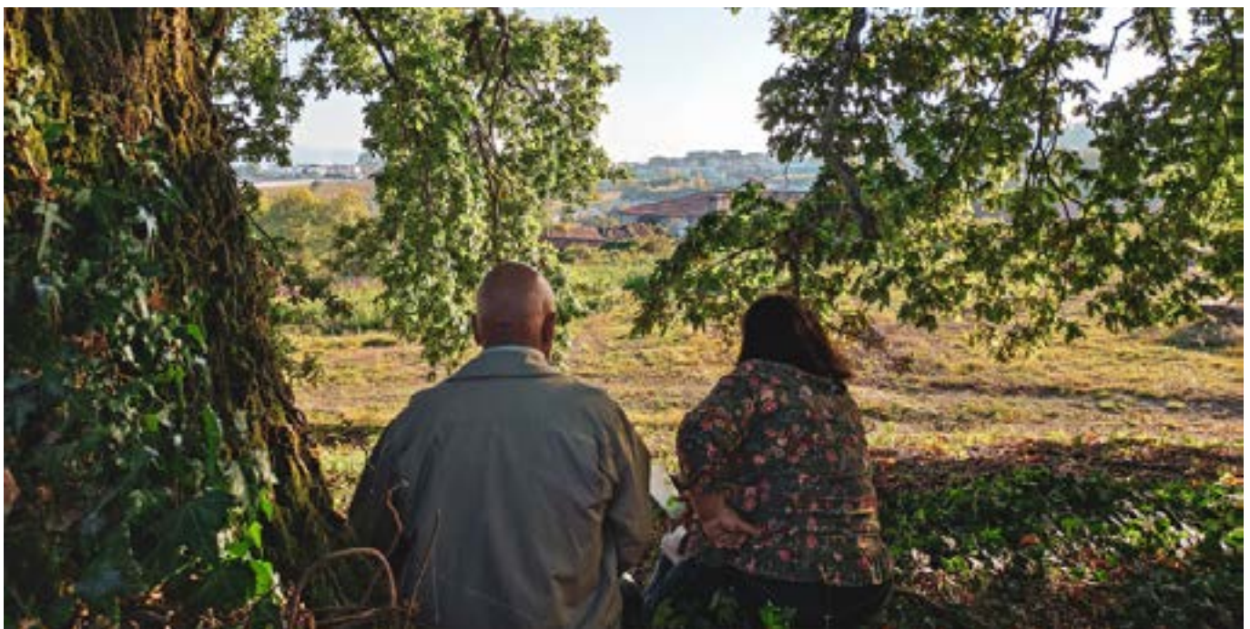
Miljøundervisningsaktivitet om kæmpestore indfødte træer i Lousada, Portugal

11. Promovere og formidle projektet på projektets hjemmeside, sociale medier eller gennem pressemeddelelser. Håndter også al kommunikation på et datagrundlag, f.eks. i et Excel-dokument). Udvikling af en effektiv kommunikations- og formidlingsstrategi giver mulighed for at øge rækkevidden af frivilligprojekter og -programmer, hvilket igen skaber større anerkendelse og synlighed. Etablering af samarbejde og partnerskaber, som nogle gange bliver afgørende for projektets udvikling og bæredygtighed, opstår ofte på grund af evnen til at kommunikere åbent og regelmæssigt. Når der samtidig dukker nyheder op i medierne eller i pressen om aktioner, hvor seniorer var de aktive aktører, opstår der en stor følelse af stolthed og selvværd, som fremmer sund aldring, fordi seniorer føler sig nyttige og offentligt anerkendte.