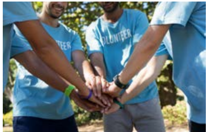
Portugal Miljøfortolkningstur med seniorer i en oprindelig skov i Lousada, Portugal