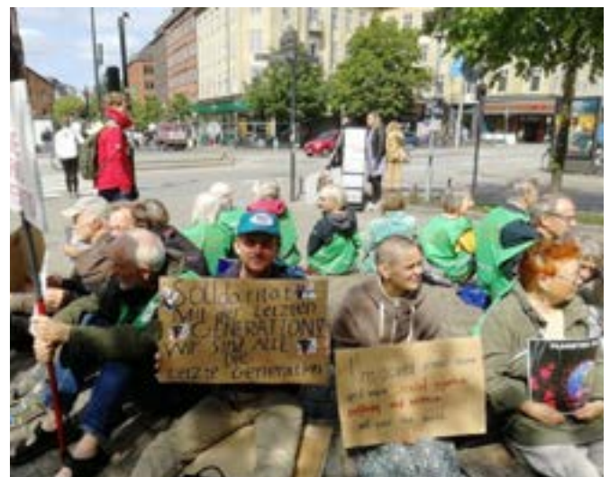
Bedsteforældres klimaaktion i en demonstration for klimaet i Aarhus, Danmark

Artikel 45 Udbydere af frivilligt arbejde skal sikre den frivilliges privatliv og arbejdsliv og skal også beskytte deres data.