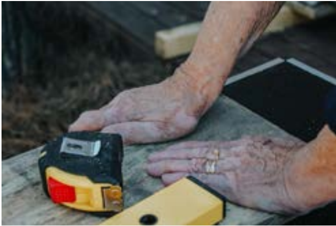
Konstruktion af en træxylofon i en miljømæssig, ludopædagogisk aktivitet med seniorer

Der er videnskabeligt belæg for, at man i nogle årtier har fokuseret på at forstå, hvordan frivilligt miljøarbejde, især inden for økologisk genopretning, er til gavn for seniorer. Undersøgelser viser, at fordelene omfatter de ældres generelle tilfredshed med den socio-emotionelle sfære, nemlig tilfredsheden med at møde mennesker med samme interesser, få nye venner, føle sig som en del af et sammenhængende fællesskab, være uden for hverdagens rutinekontekst, være i et miljø, der vækker følelser af (gen)forbindelse til det omgivende miljø (naturen) og fascination. Dette scenarie har en indvirkning på den frivillige, som kan afspejle sig i en sindstilstand, der fremmer introspektiv refleksion. Fra et intellektuelt perspektiv er der effekter på niveauet for personlig udvikling og vækst gennem følelsen af præstation i lyset af den udfordring, der præsenteres, da nogle opgaver kræver ekspertise, men også giver ny læring, følelsen af tilfredshed med at bidrage med noget håndgribeligt, der hjælper med at