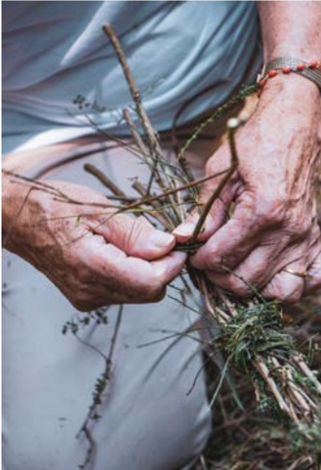
Værksted med traditionelle koste lavet af indfødte buske (Lousada, Portugal)

elementer, ressourcer, økosystemer og tjenester, som er uløseligt forbundet og afhængige af hinanden. Ethvert naturligt økosystem fungerer i ligevægt og består af et komplekst netværk af alle levende og ikke-levende væsener, der findes i et givet område og påvirker andre væseners adfærd og overlevelse. Forstyrrelser, der introduceres i et økosystem ét sted, påvirker hele systemet, som både er modstandsdygtigt og skrøbeligt. Ødelæggelse af levesteder forårsaget af skovrydning er en af de mest