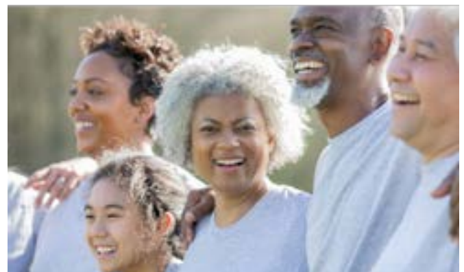
Aktivitet på tværs af generationer om natur og lokale traditioner i Lousada, Portugal

Det er derfor klart, at teamlederen og/eller koordinationssteamet er nødt til at informere de frivillige i detaljer om de sundheds- og sikkerhedsmæssige forhold i det land, hvor de arbejder, og om deres egen organisations politik.