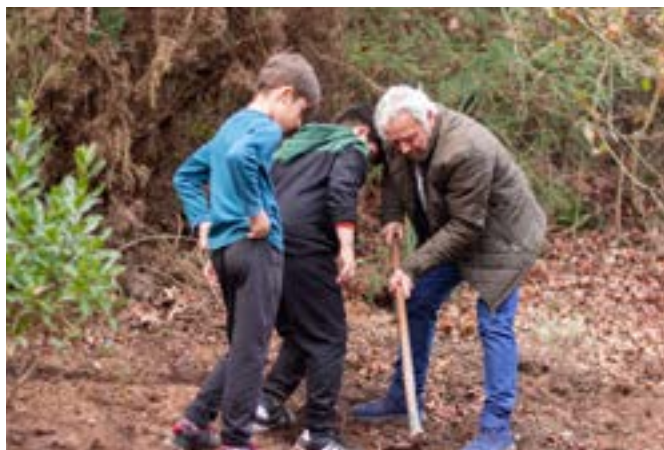
Plantning af indfødte arter på tværs af generationer i Lousada, Portugal